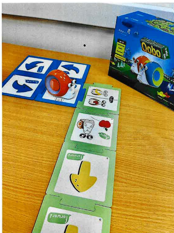
Obrázek 2: Pomůcka pro klienty - Programovací Robo-šnek