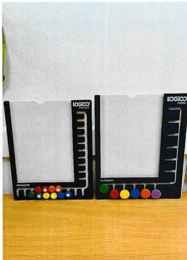
Obrázek 4: Učební systém pro klienty - Logico Piccolo a Primo