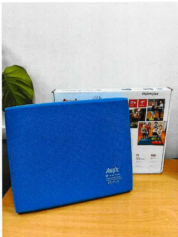
Obrázek 3: Pomůcka pro klienty - Balanční podložka