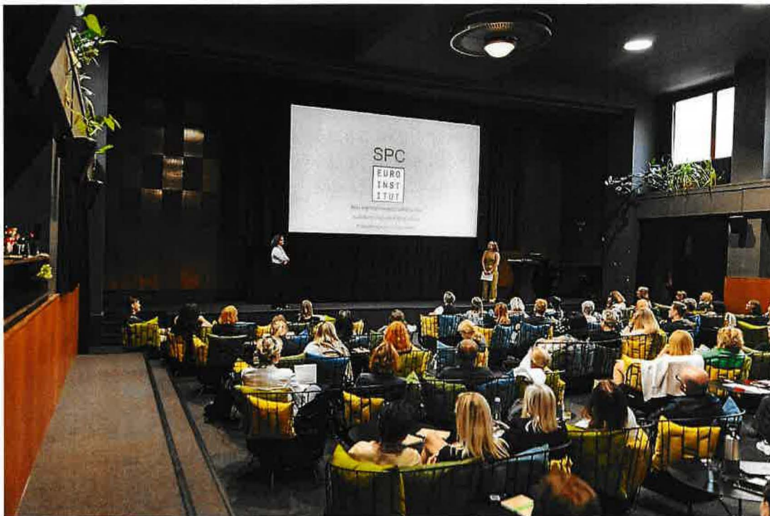
Obrázek 6: Prezentace SPC na Konferenci sítě škol Euroinstitut