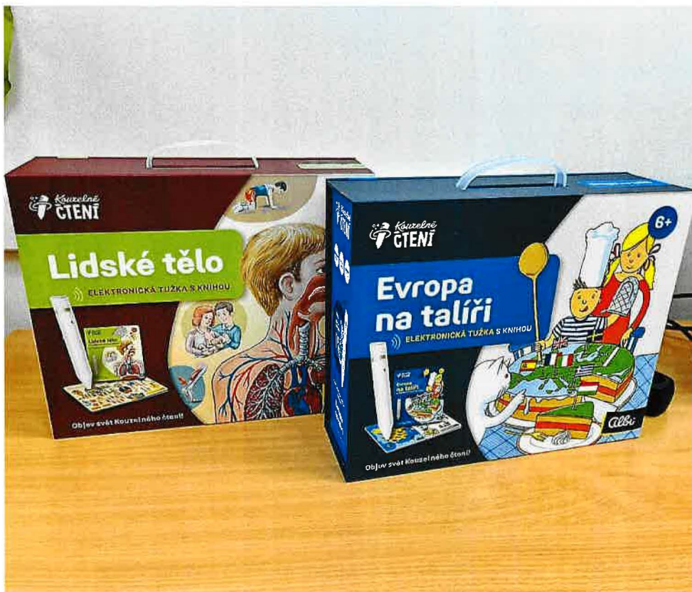
Obrázek 1: Pomůcka pro klienty - Albi tužky kouzelné čtení